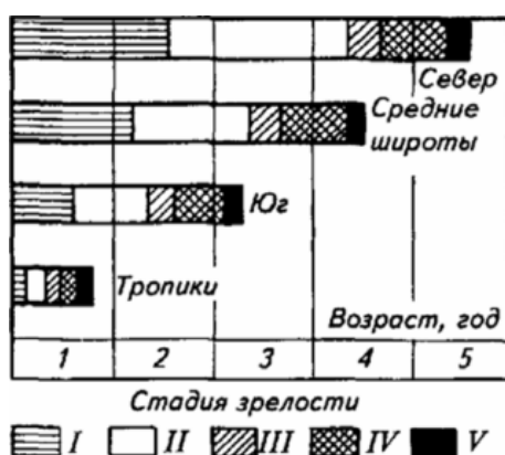
Рис. 1 - Скорость развития репродуктивной системы и возраст наступления половой зрелости у самок карпа в водоемах разных широт

В прохождении отдельных звеньев репродуктивного цикла также очень существенна роль температурного режима. Так, только при определенной температуре у рыб начинается нерест. Влияние температуры на скорость полового созревания отмечено у всех холоднокровных животных. Например, карп в зависимости от климатических зон может достигать половой зрелости в возрасте 5–6 лет (Карелия) и в 6–8 месяцев (Куба). При этом меняется и периодичность прохождения нереста. Температурный режим также влияет и на продолжительность жизни гидробионтов. Например, раннее наступление половой зрелости приводит к тому, что рост рыб резко замедляется. Если прохождение отдельных стадий развития в результате повышения температуры воды ускоряется, то продолжительность всех стадий в совокупности, а, следовательно, и всей жизни сокращается. Карп на Кубе редко живет более 8 лет, тогда как в центральных районах он доживает до 20 лет и более.